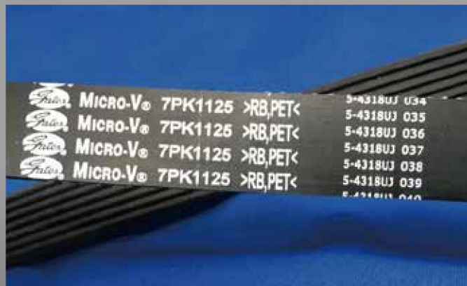
【ベルト外観（品番末尾の記号は廃止）】